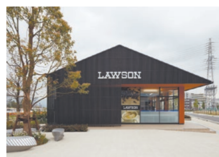
ローソン ビナガーデンズ店

都市の中心に「木造コンビニ」。触れて香って感じる「木を魅せる木造」とすることで、訪れる人々が安らぎや温かさを感じ、社会的ニーズである木材活用にも貢献し得る、高価値な建築を実現しました。「木造コンビニ」が、誰もが気軽にふらっと立ち寄れて集まれる「コンビニの形をしたコミュニティ」に育つことを期待します。私たちは今後もより良い建築を社会に提供すべく努めてまいります。