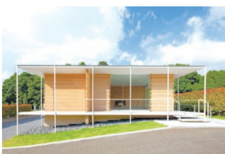
校舎造りでつくられた「手紙処」

「手紙処」と「手紙標」は、どちらも「手紙寺 證大寺」が管理する霊園内にあります。「手紙処」では、遺族が霊園内を見渡しながら故人に想いを馳(は)せ、ゆっくりと手紙を書くことができます。また、生前に遺族や友人宛の手紙を書いて、それをお寺へ託すこともできます。参道には「手紙標」が6カ所設置されています。いにしへの作家などが家族や知人に宛てた手紙を刻印したもので、参詣者を「手紙処」へ導くための道標です。