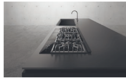
最上位モデル「G:ライン」

高級キッチン向けモジュールタイプのガスドロップインコンロシリーズ。ライフスタイルにあわせ個数や配列の自由な組み合わせが可能。意匠性は海外のトレンドに習い、操作内容表示もビクトやパラメーターによる言語に頼らない表示としました。ガラスタッチパネル式の操作部は先進性があり清掃性も高く、美観性としても優れています。