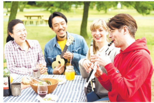
カジュアルな演奏に最適

ならでは本格的な吹きごえと2オクターブの音域を備えた、管楽器経験者も満足できる楽器です。ABS樹脂製のため軽量ながらも耐久性に優れ、水洗いも可能です。さらに、コンパクトなサイズでどこでも気軽に持ち出せて、アウトドアやカジュアルなセッションなどさまざまな場面で手軽に演奏を楽しむことができます。