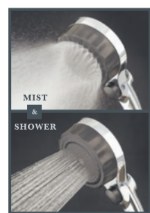
MIZSEIショップで販売中

美しく生きたい全ての女性へ。『ファインバブル・ミスト水流・節湯30%』が特徴の多機能シャワー。ファインバブルが持つ洗浄・温浴・保湿の3つの効果を楽しめます。シャワー・ミストの両水流とも1分間で約8億個以上のファインバブルを放出。細かいミストは肌への優しい刺激で健康美肌へ。さらに節湯効果も30%。水道光熱費を年間で約20,000円削減出来ます。