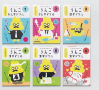
蛍光を使いかわいくポップなデザインに

本書は、小学校で習う1006の漢字を「うんこ」という言葉を使って覚える、今までにない発想の学習参考書です。ただ面白いだけではなく、新学習指導要領にも対応。例えば「号」という漢字なら「出席番号順にうんこを提出する」、「画」なら「うんこだけをかく画家」といった例文で、子どもが笑いながら勉強できる全く新しい漢字ドリルです。