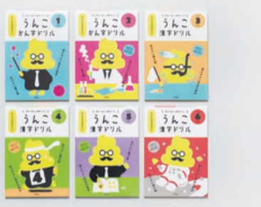
蛍光を使いかわいくポップなデザインに

本書は、小学校で習う1006の漢字を「うんこ」という言葉を使って覚える、今までにない発想の学習参考書です。ただ面白いだけではなく、新学習指導要領にも対応。例えば「号」という漢字なら「出席番号順にうんこを提出する」、「画」なら「うんこだけをかく画家」といった例文で、子どもが笑いながら勉強できる全く新しい漢字ドリルです。