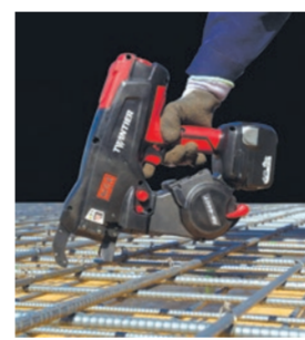
結束の現場を支援します

世界初※、2本のワイヤを同時に送り、輪を作りねじることで鉄筋を結束する充電式鉄筋結束機です。近年、建設業の人手不足や建設需要の高まりを背景に、忙しさを増す建設現場では少ない人数で作業をしなければならず、今まで以上に効率化が求められています。本製品は結束スピード、結束力を向上するなど、現場での使いやすさを徹底的に追求し、鉄筋結束作業の効率化に貢献していきます。 ※2017年10月 マックス調べ