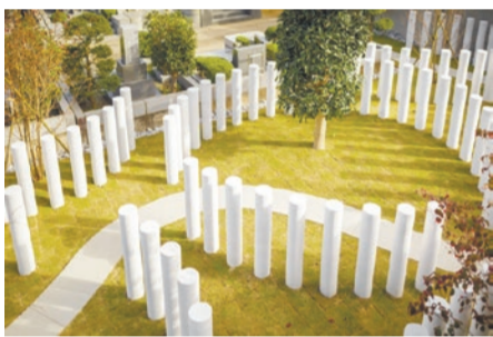
墓地の区画に左右されないデザイン

&(安堵)はふたりで入る新しいタイプのお墓です。間柄は全く自由です。誰とでも入れます。性別や国籍も問いません。お墓の維持・継承についても、お寺が責任をもって引き継ぎます。&(安堵)は、直径20cm、高さ120cm、白い大理石でつくられた円柱型のお墓です。人の体の大きさに合わせたシンプルなデザインで、故人と対話したり、触れたり、抱きしめたりできます。霊園の自然環境の中の、さわやかな風景となるお墓です。