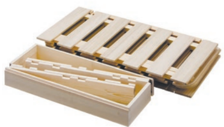
並べるだけの簡単設置!

持ち運びにかさばるベッドフレーム。いくつにもパーツが分かれて梱包され、組み立ても煩わしい。そんな懸念を払拭するベッドフレーム。Z型に折りたたまれる天然の赤松材の架台は、工具は一切使わず、女性でも簡単に組み立て可能。すのこは調湿効果・抗菌効果の高い桐材を使用。使わないときはコンパクトにしまえるので、一般家庭だけでなく旅館などの宿泊施設等でも活躍。