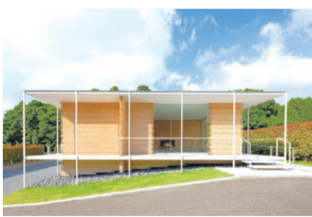
校舎造りでつくられた「手紙処」

「手紙処」と「手紙標」は、どちらも「手紙寺 證大寺」が管理する霊園内にあります。「手紙処」では、遺族が霊園内を見渡しながら故人に想いを馳(は)せ、ゆっくりと手紙を書くことができます。また、生前に遺族や友人宛の手紙を書いて、それをお寺へ託すこともできます。参道には「手紙標」が6カ所設置されています。いにしへの作家などが家族や知人に宛てた手紙を刻印したもので、参詣者を「手紙処」へ導くための道標です。