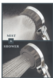
MIZSEIショップで販売中

美しく生きたい全ての女性へ。『ファインバブル・ミスト水流・節湯30%』が特徴の多機能シャワー。ファインバブルが持つ洗浄・温浴・保湿の3つの効果を楽しめます。シャワー・ミストの両水流とも1分間で約8億個以上のファインバブルを放出。細かいミストは肌への優しい刺激で健康美肌へ。さらに節湯効果も30%。水道光熱費を年間で約20,000円削減出来ます。