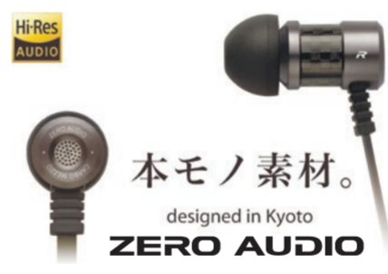
国内最高クラスの権威あるVGPも連続受賞

リアルカーボンファイバーや削り出しアルミニウムなど本モノ素材を使用したこだわりいっぱいのイヤホンです。深みのある重低音からのびやかで繊細な高音域までハイレゾ音源を忠実に臨場感豊かに再現します。デザインはもちろんのこと、企画、開発、設計までのすべてを京都で行い、個性的なスタイルに仕上げました。国内最高権威のオーディオビジュアルアワード/VGPも連続受賞中です。